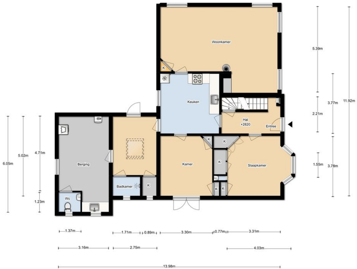
MIDDENSTRAAT 34 BEGANE GROND

DEZE PLATTEGRONDEN ZIJN MET DE GROOTSTE ZORG SAMENGESTELD EN DIENEN TER INDICATIE. ER KUNNEN GEEN RECHTEN AAN WORDEN ONTLEEND. © WWW.DROOMHUIS360.NL